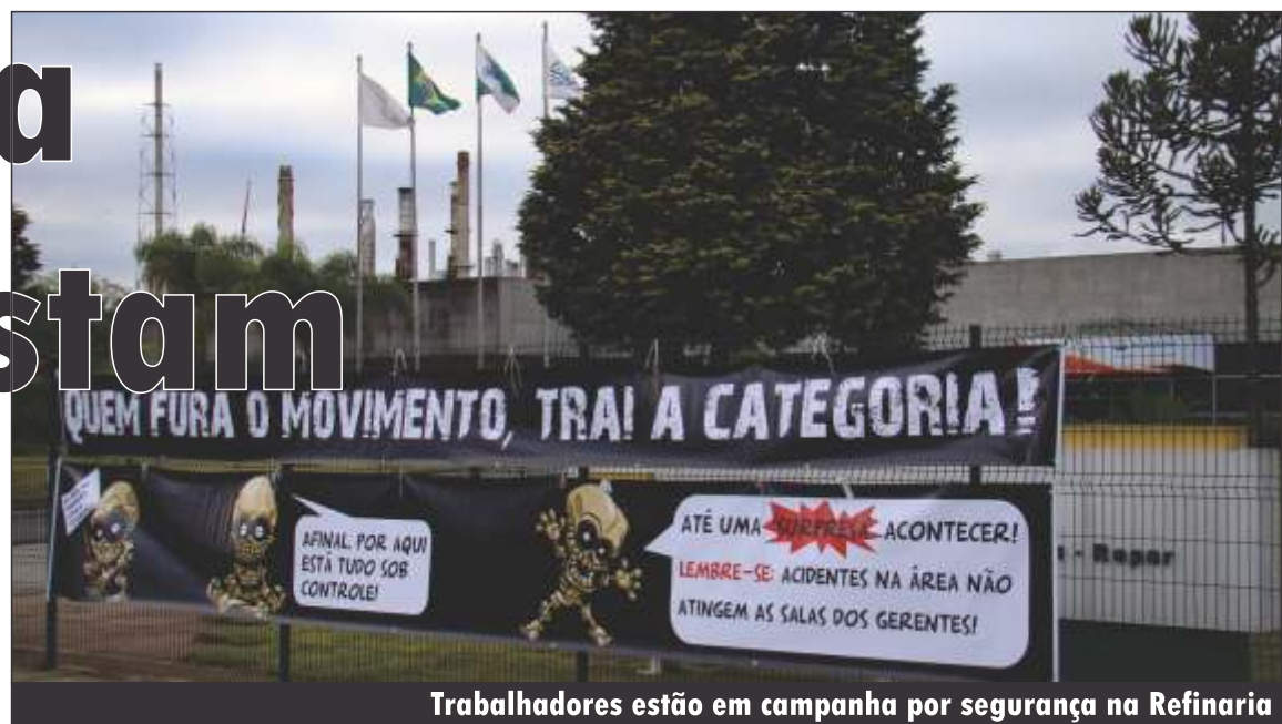
Trabalhadores estão em campanha por segurança na Refinaria

O último acidente fatal na Repar foi um atropelamento em 2010. Os índices recentes só não são maiores por mera sorte. A Refinaria tem reduzido sistematicamente os custos com a manutenção preventiva dos equipamentos e há sobrecarga de trabalho devido ao baixo número de trabalhadores.