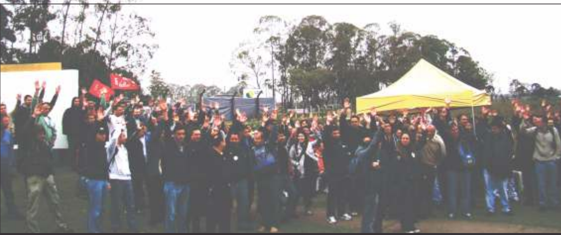
Trabalhadores aprovaram intensificação do movimento

Diante deste cenário de perigo iminente, os trabalhadores da Repar se organizaram e discutiram, setor por setor, o déficit de funcionários. O resultado apontou que é necessária a contratação imediata de 400 trabalhadores para suprir com a demanda das unidades antigas e também das novas que estão entrando em operação com a finalização das obras de ampliação da Repar.