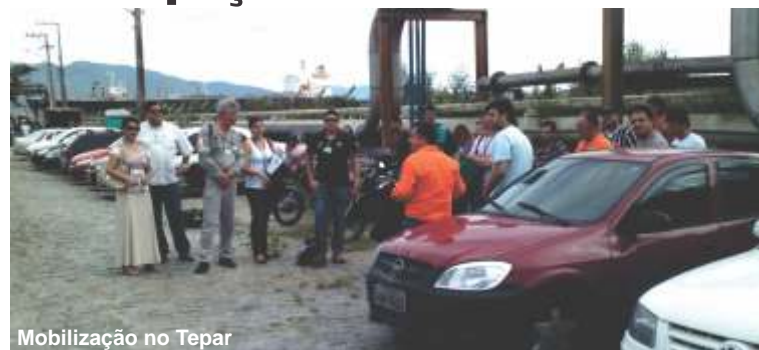
Mobilização no Tepar

Petroleiros rejeitaram a proposta de adiantamento da PLR 2012 e cobraram o início imediato da negociação do montante total do lucro a ser provisionado para os trabalhadores e a retomada das negociações do regramento das PLR futuras. Mobilizações aconteceram em todas as unidades do PR e SC.