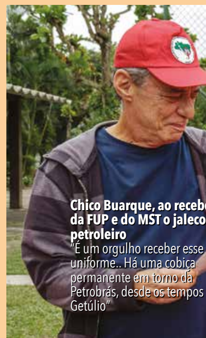
Chico Buarque, ao receber a FUP e do MST o jaleco de petroleiro

"Mais do que enfrentar o plano de desinvestimento, a greve significa um enfrentamento ao capital internacional especulativo. Os setores populares e sindicais não podem ter nenhuma dúvida de que lado devem estar".