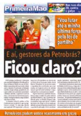
Petroleiros podem entrar novamente em greve