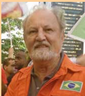
João Pedro Stedile Movimento dos Trabalhadores Sem Terra (MST)

"Os petroleiros estão fazendo uma greve patriótica para salvar a Petrobrás para o povo brasileiro. E o único patrimônio de riqueza natural que ainda podemos usar em benefício do povo é o petróleo".